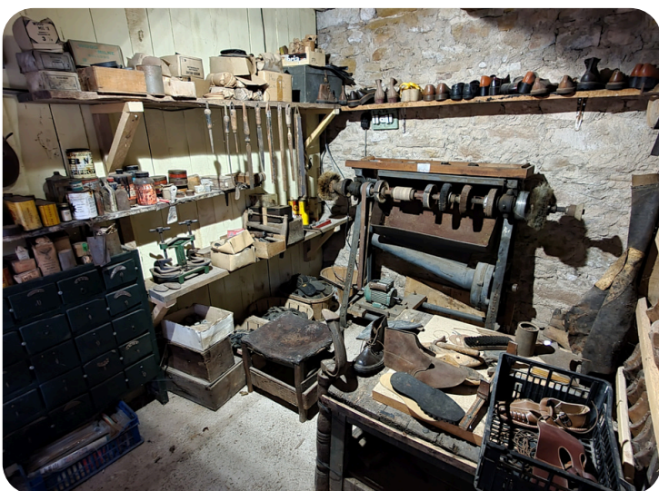
Le village : l'atelier du cordonnier