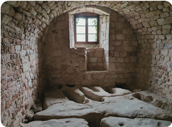
Le château : la nécropole rupestre