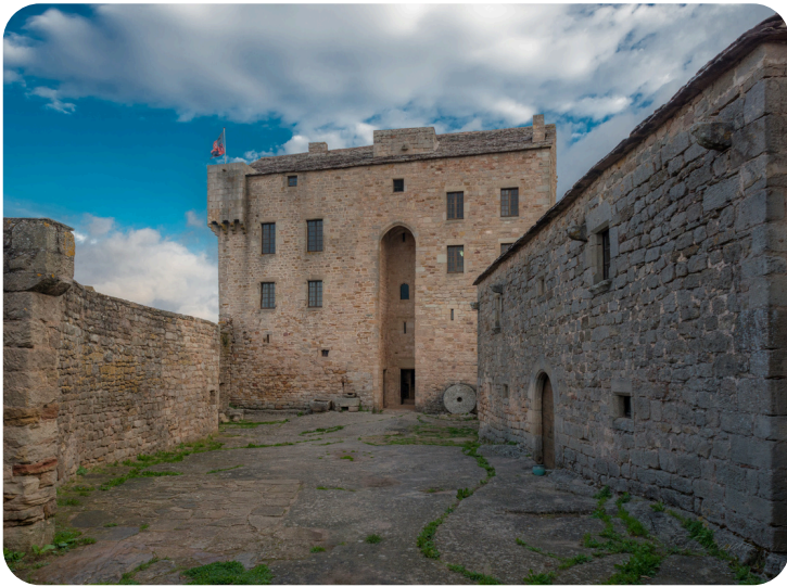
Le château et sa singulière façade monumentale