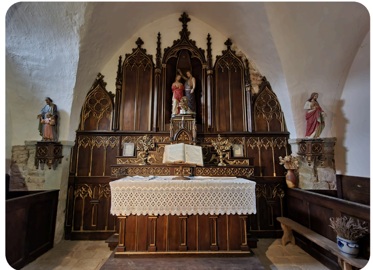
Le village : l'église et ses boiseries du XIXe siècle