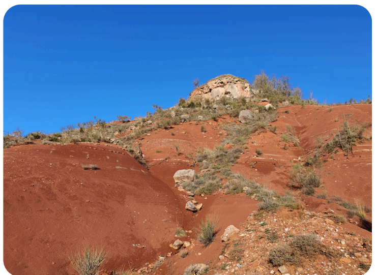
Le rouquier, paysage typique de Montaigut