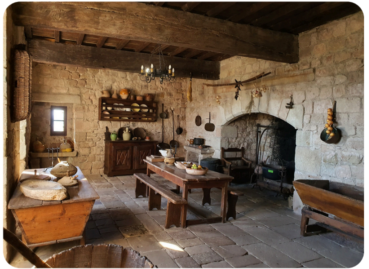
Le château : la cuisine du XIXe siècle